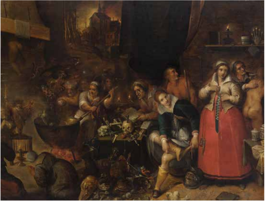
FIGUUR 1 Frans Francken de jongere: De heksenkeuken (1606); gehele schilderij (A); details: rechts wordt een heks met de zalf ingesmeerd (B) en linksboven verdwijnt een andere heks per bezemsteel door de schoorsteen (C)