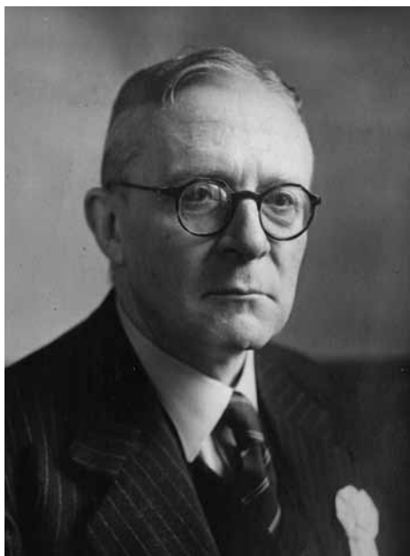
FIGUUR 2 Henricus C. Rümke

Uit zijn omvangrijke oeuvre zie ik Inleiding in de karakterkunde uit 1929 (Rümke 1929) als een van zijn belangrijkste werken. Het was in feite een eerste Nederlandstalig overzicht van wat later persoonlijkheidsleer werd genoemd. ‘Hoewel het begrip karakter niet vast omljnd is, zijn er vele karakterologieën’ schrijft Rümke. Hij haalt de eeuwenoude