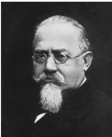
FIGUUR 6 Cesare Lombroso

In het werk van Rümke wordt Lombroso herhaaldelijk genoemd. In deel II van zijn leerboek schrijft hij: 'Men kan aan het werk van Lombroso en zijn volgelingen, waarover zovelen thans alleen met een smalende glimlach spreken, niet voorbijgaan. Natuurlijk zal een zeer kritische instelling daarbij nodig blijven, want er is destijds - zoals het zo vaak gaat met een nieuwe leer - zeer veel overdreven en kritiekloos overgenomen' (Rümke 1960). In deel III zegt Rümke, als hij spreekt over genetische stigmata: 'Als indruk kan ik dit zeggen: een samengaan met de bekende stigmata, door Lombroso het eerst aangegeven, is mij niet opgevallen, wel andere kenmerken waarvan niet vaststaat in hoeverre zij genetische minusvormen genoemd kunnen worden' (Rümke 1967).