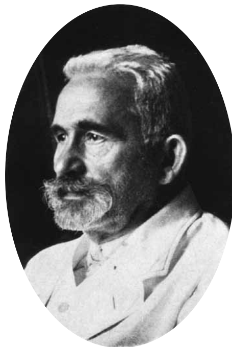
FIGUUR 3 Emil Kraepelin

psychosen. Onder het concept ‘dementia praecox’ bracht hij een aantal ernstige psychosen samen, waaronder de katatonie beschreven door Kahlbaum (1874) en de hebefrenie beschreven door Hecker (Hecker 1871; Sedler 1985). Over de prognose was hij pessimistisch omdat hij ervan uitging dat er uiteindelijk een eindtoestand ontstond die het beste als affectieve demencie kan worden beschreven (Wilschut 2005). Zijn zorgvuldige omschrijvingen van de symptomen en het beloop hebben geholpen om nosologische eenheden af te bakenen, te verdiepen en te bekritisieren. De dementia paranoides, hebefrenie en katatonie zijn vandaag te herkennen in het paranoïde, gedestruktiseerde, katatone en ongedifferentieerde type van schizofrenie.