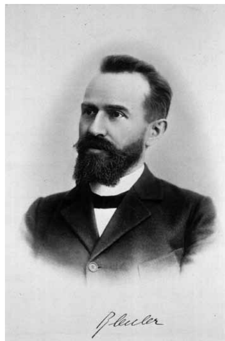
FIGUUR 4 Eugen Bleuler

Het bekendst zijn de beschrijvingen van de fundamentele symptomen van schizofrenie; de