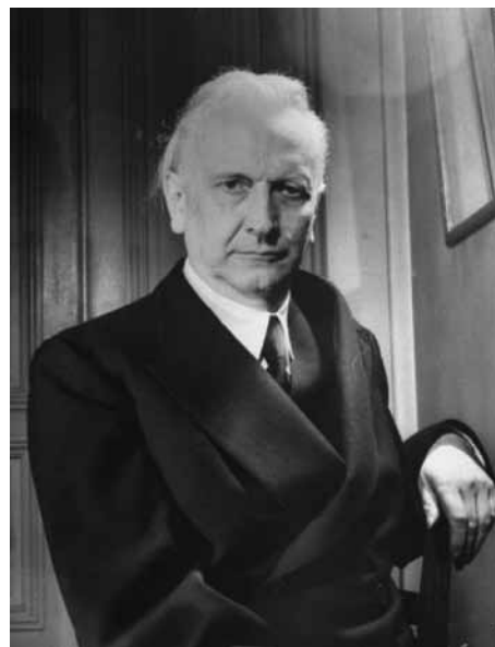
FIGUUR 5 Karl Jaspers

beschrijving in de volgende eeuw nog een belangrijke basis is voor Symptoms in the mind (Sims 2003) en Het psychiatrisch onderzoek (Hengeveld & Schudel 2003). In het tweede deel introduceert hij de ‘verstehende’ psychologie. Verstehen gaat over het begrijpen van ziekelijke psychische verbanden: ten eerste trachten te begrijpen wat op het eerste gezicht vreemd en onbegrijpelijk is (bijvoorbeeld driftmatige wreedheid) en ten tweede trachten te ontdekken van een op zich universeel begrijpelijke samenhang in psychische toestanden die door abnormale mechanismen tot stand lijken te zijn gekomen (bijvoorbeeld dissociatie) (Hengeveld 2006; Glas 2013).